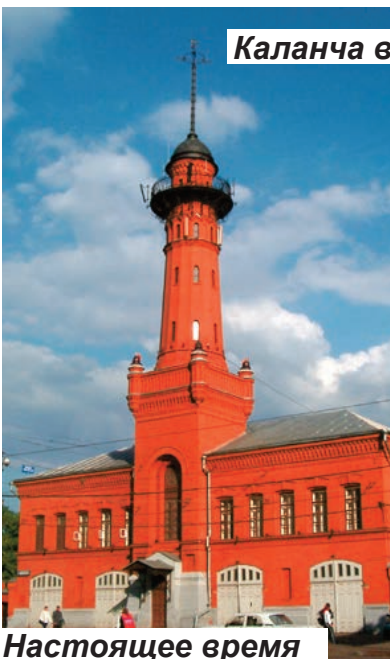
Каланча в Сокольниках

В Москве мы можем встретить каланчу 12-ой пожарной части около станции метро Сокольники, каланчу бывшей Сущёвской пожарной части, а также каланчи на Мосфильмовской улице и